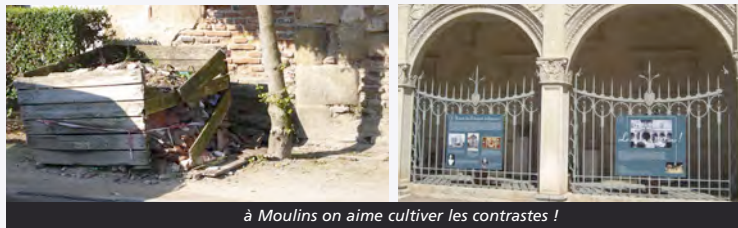
à Moulins on aime cultiver les contrastes !

On n'aime pas qu'il reste depuis deux ou trois ans une palette éventrée de déchets devant la Mal Coiffée. Elle préside à toutes les commémorations officielles concernant la dernière guerre mondiale... Belle image !